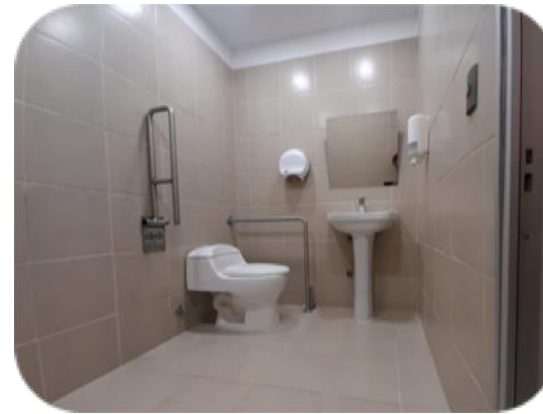
Baños Mixtos y Accesibles en Talleres y CCA