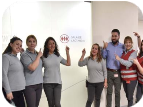
Salas de Lactancia Cca y Tobaraba