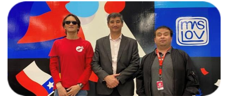
Lazarillo, implementación en 11 nuevas estaciones