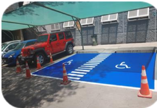
Estacionamiento Accesible aller San Eugenio